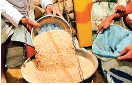
हरिभूमि न्यूज ॥ ब्यावरा/राजगढ़

सार्वजनिक वितरण प्रणाली के तहत पात्र उपभोक्ताओं को राशन का वितरण न करते हुए करीब 10 लाख की गड़बड़ी करने वाले पूर्व सेल्समैन पर खाद्य विभाग ने मुकदमा दायर करवाया है। विभाग के प्रतिवेदन के आधार पर भोजपुर थानाक्षेत्र की डोरियाखेड़ी राशन दुकान के सेल्समैन पर यह एफआईआर दर्ज की गई है।