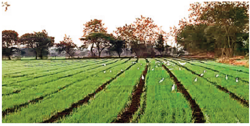
हरिभूमि न्यूज ॥ राजगढ़

पिछले दिनों पूरे प्रदेश में सबसे कम 2.0 डिग्री तक लुढ़का जिले का तापमान अब उछाल मारते हुए 4.6 डिग्री तक पहुंच चुका है। तापमान में उछाल से भीषण सर्दी की मार झेल रहे लोगों में थोड़ी राहत की सांस ली है। इसके साथ ही दिन के समय