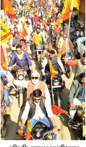
हरिभूमि न्यूज ॥ नरसिंहगढ़

आगामी भव्य हिन्दू सम्मेलन के पूर्व नगर में आज विशाल वाहन रैली निकाली गई, जिसमें बड़ी संख्या में