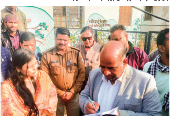
सारंगपुर